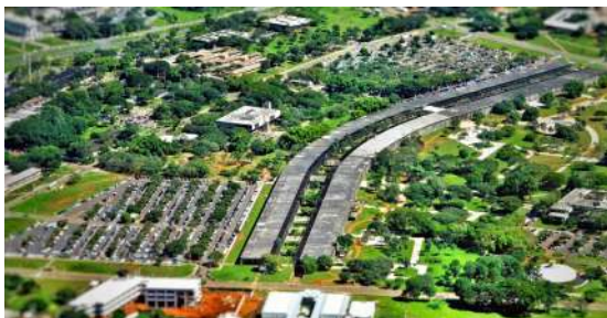
Vista aérea – Universidad de Brasília