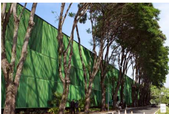
Anexos II-A y II-B del Supremo Tribunal Federal