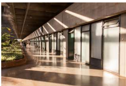
Instituto Central de Ciencias - Uni- versidad de Brasília