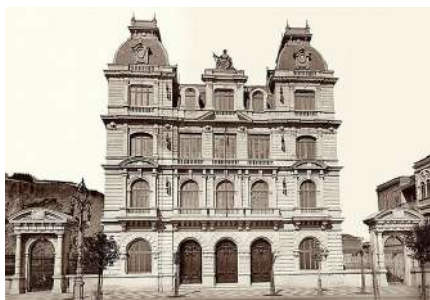
Antigua Sede del Supremo Tribunal Federal em Rio de Janeiro, 1910